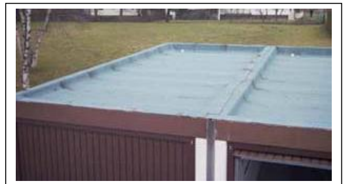
Garage mit Flachdach