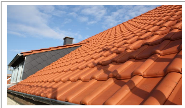
Geneigtes Dach mit Ziegeleindeckung