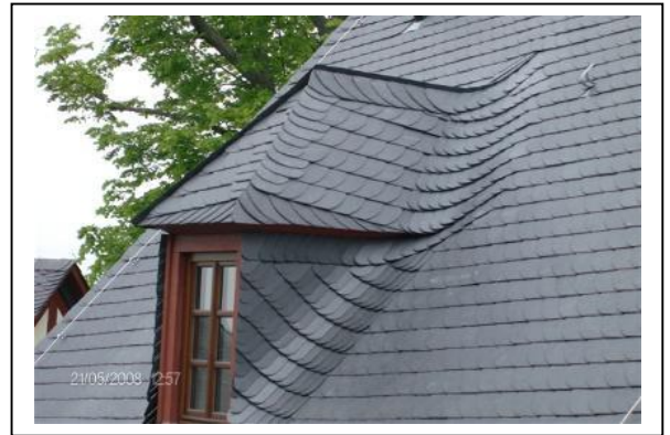
Geneigtes Dach mit Schieferdeckung