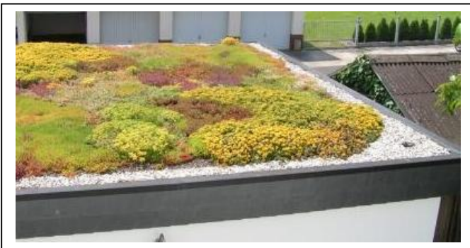
Garage mit begrünem Flachdach